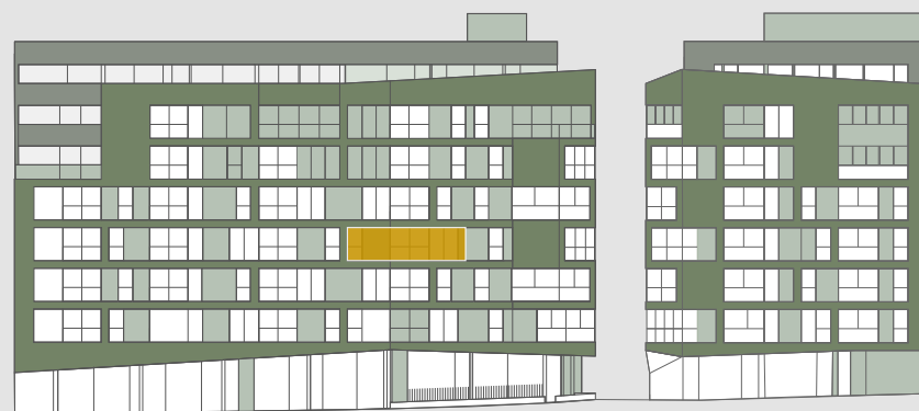
C/ PALOS DE LA FRONTERA